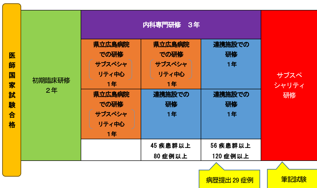
図1. 県立広島病院内科専門研修プログラム(概念図)

原則として基幹施設である県立広島病院での1年間と連携施設での1年間又は基幹施設である県立広島病院での2年間で、専門研修(専攻医)1、2年目の専門研修を行います。